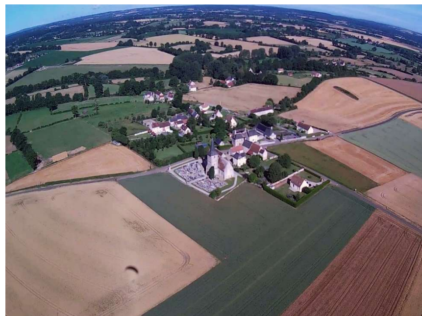
Vue panoramique du bourg de Joué du Plain

Si vous souhaitez organiser la fête des voisins dans vos quartiers et hameaux la date officielle est le Vendredi 24 Mai 2019